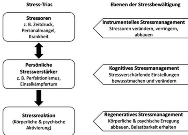
Abb. 2. Darstellung der Stress-Trias als Rahmenkonzept zur Entstehung der Stressreaktion und der drei Ebenen der individuellen Stressbewältigung (in Anlehnung an Kaluza 2004 [3]).